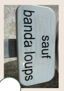
Banda Loups formation musicale de la commune. «Les loups» est l'ancien nom donné aux habitants du Bois-Plage