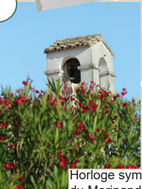
Horloge symbole du Morinand

Petit clin d'oeil à l'emplacement de l'ancienne gare du Bois-Plage-en-Ré